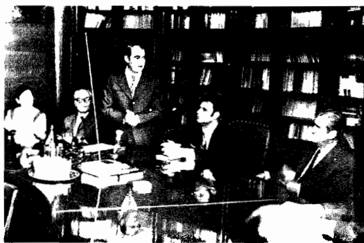
La masa prezidiului

spiritului său, împărțea dreptatea oamenilor.